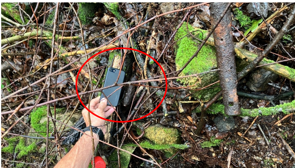
Obrázek nálezů (granát vedle mobilu).